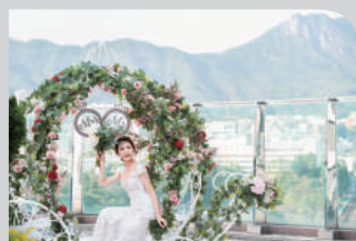
深心薈 8樓 ■

喜宴堂由三個獨立宴會廳組成，設計靈活。無柱寬敞的大宴會廳可容納 80 至 600 位賓客。三個獨立的宴會廳 I、II 及 III 的總面積為 508 平方米 (5,476 平方呎)，佈置富麗堂皇並設有大型落地玻璃，遙望香港著名地標獅子山的景色。喜宴堂可作為會議、雞尾酒會及宴會場地之用。