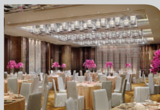
喜酌堂 3樓 ■

深心薈可容納80位賓客。飽覽獅子山的迷人景致，坐擁360度開揚視野，讓您與伴侶於環山抱翠，藍天白雲的歐式空中花園中，舉行浪漫優雅的戶外婚禮或證婚派對。