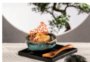
獅房菜 3樓 ■

屢獲殊榮的中菜廳帝京軒，呈獻一系列當代粵式高級美饌，由精緻點心、滋補燉湯至生猛海鮮，一應俱全，必吃推介：鐵板蜜餞黑豚叉燒、金湯乳酪龍蝦球。