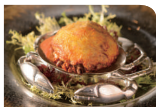
帝京軒 3樓 ■