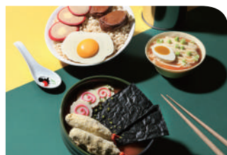
ROYAL DELIGHTS (R+) 1樓 ■

全新中菜概念餐廳—獅房菜，以香港著名地標獅子山作靈感，糅合粵菜精粹及川菜元素，炮製出一系列注入獅子山下的味道及情懷的精緻美饌。傳統與新派元素細膩交融，配合細心周到的服務，為您提供嶄新的感官及餐飲體驗。